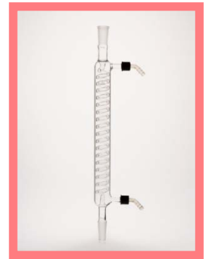
冷却管 グラハム型